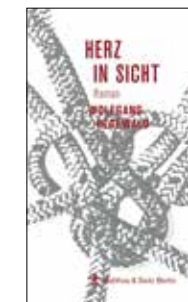
„Herz in Sicht“, Matthes & Seitz, 285 Seiten, 19,90 Euro