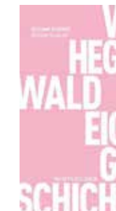
„Die eigene Geschichte“, Matthes & Seitz, 176 Seiten, 14,80 Euro