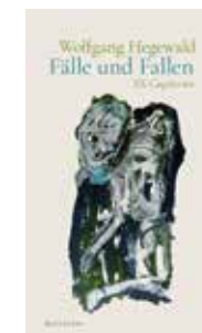
„Fälle und Fallen“, Wallstein, 79 Seiten, 16 Euro