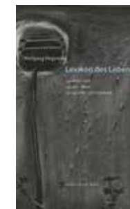
„Lexikon des Lebens“, Matthes & Seitz, 367 Seiten, 28 Euro