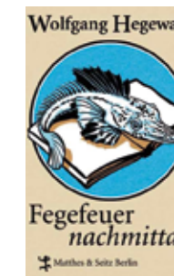
„Fegefeuer nachmittag“, Matthes & Seitz, 256 Seiten, 19,80 Euro